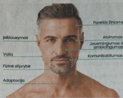
Veidas gali atskleisti ne vieną mūsų asmenybės bruožą

Jau pats žodis „veidotyra“ sako, kad tai – veido tyrinėjimas, iš tam tikrų bruožų galintis atskleisti žmogaus charaktero ypatybes, talentus, kurių jis pats galbūt dar nežino.